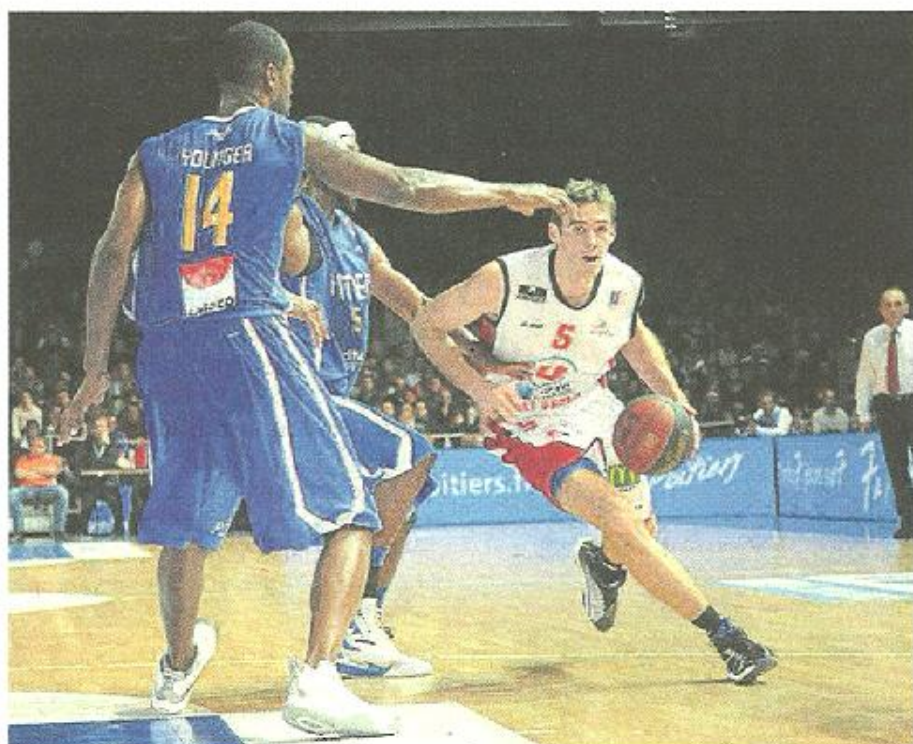
La Nouvelle République

Les protégés d'Erman Kunter semblaient avoir retenu la leçon et paraient les plus forts dans le troisième quart-temps. Causeur-Nelson, le duo fonctionnait et l'Américain s'éclatait à trois points (42-56, 27'). Le match semblait avoir définitivement tourné en faveur des visiteurs mais les Poitevins, qui jouent à chaque journée leur survie en Pro A, se rebellaient et recollaient à dix points à la fin de la période (49-59). Et même à six lorsque Fournier prenait sa chance à deux points (55-61, 33'). Cholet-Basket allait-il à nouveau flancher dans le dernier quart ? Non, pas cette fois.