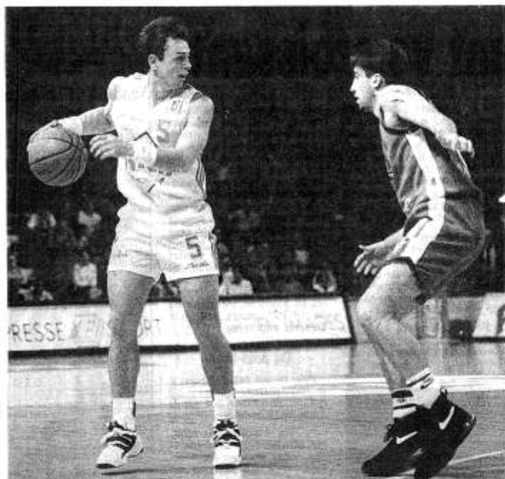
Demory et les siens peuvent être satisfaits de leur tirage de coupe

7 décembre : BM Barcelone, Cholet ; Bologne, UG Istanbul. Retour le 11 janvier.