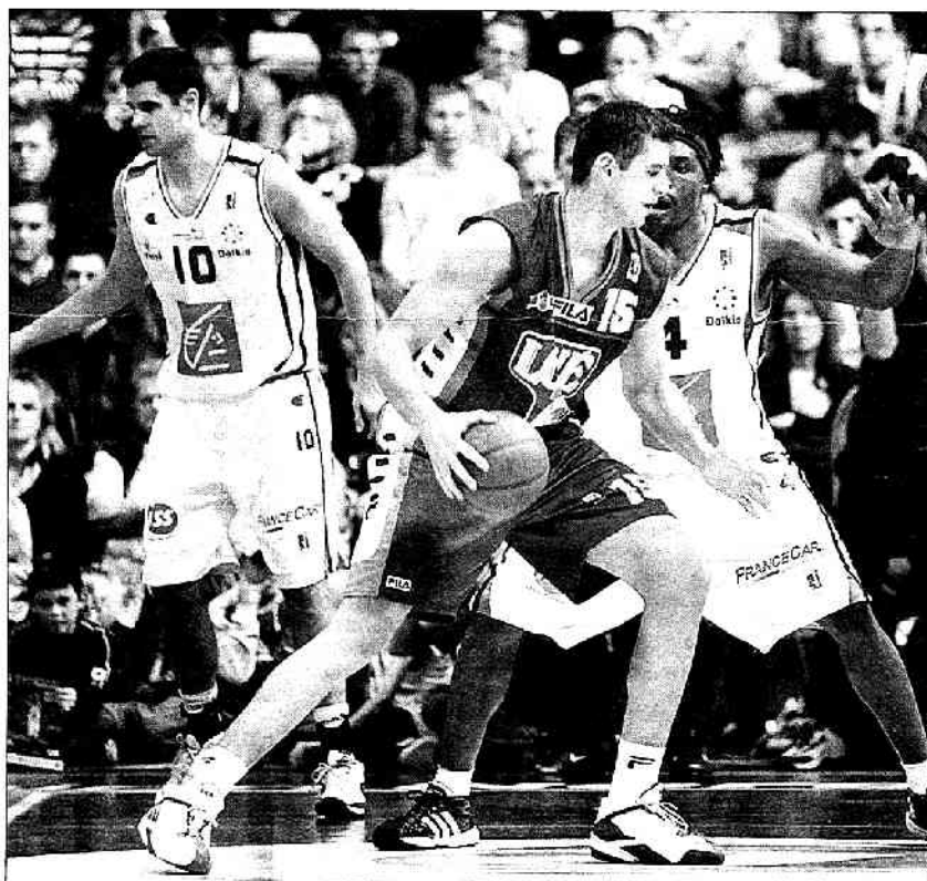
Krola et les Manceaux ont donné une leçon, hier après-midi, à des Nordistes complètement déboussolés.

Le deuxième quart-temps démarrait en effet sur les mêmes bases pour le MSB qui passait un