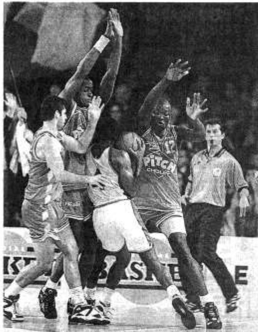
Les Antibois n'ont pas oublié cette ultime action de David Rivers la saison passée à la Meilleraie. Battus d'un point, ils avaient réclamé en vain une faute et les lancers à M. Danielou

Entre deux rendez-vous européens d'importance, Antibes et Cholet vont disputer le premier choc au sommet de la Pro A ce soir sur la Côte d'Azur. Un rendez-vous très prisé.