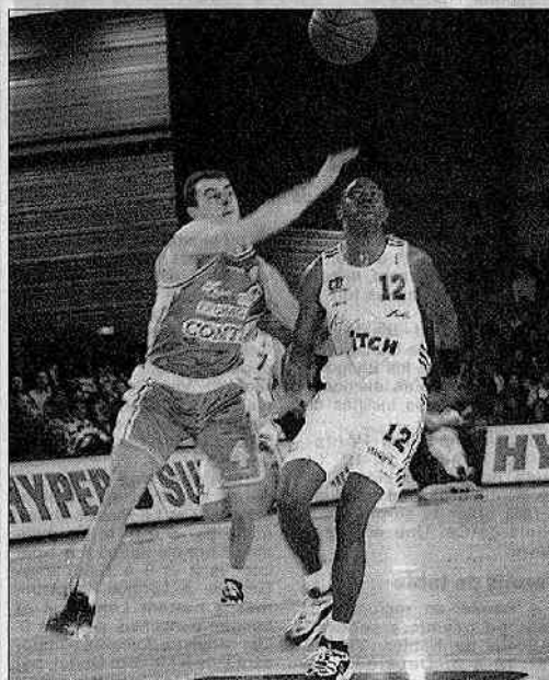
Richardson devrait signer aujourd'hui une prolongation de contrat d'au moins trois mois avec Cholet Basket.

■ MATCH AVANCÉ. — Cholet recevra le PSG le dimanche 11 janvier à 17 h 30 et non la veille, en raison du match d'Euroleague que disputera le club parisien la semaine précédente.