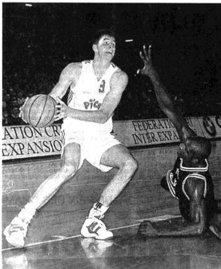
Karnishovas avait inscrit 21 pts à l'aller contre les Italiens.

En un mot, C.B. aura nécessairement besoin de toutes ses forces vives, à Bologne. « Il faudra sortir un grand match,