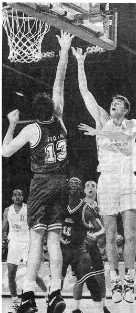
Malgré un bon Karnishovas (24 points), Cholet, diminué, n'a pas pu créer l'exploit à Bologne