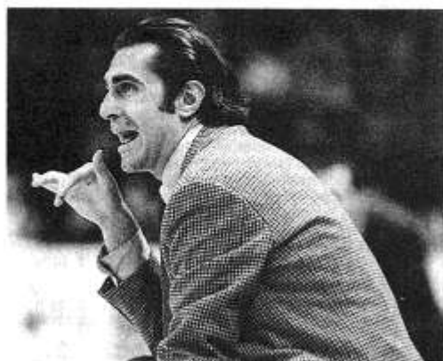
Sergio Scariolo, l'entraîneur de Filodoro Bologne