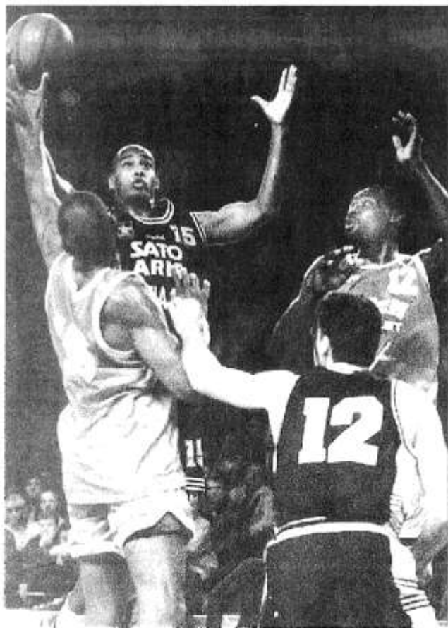
Comme lors du match aller, Higgins fut l'un des artisans de la victoire de l'Aris Salonique.