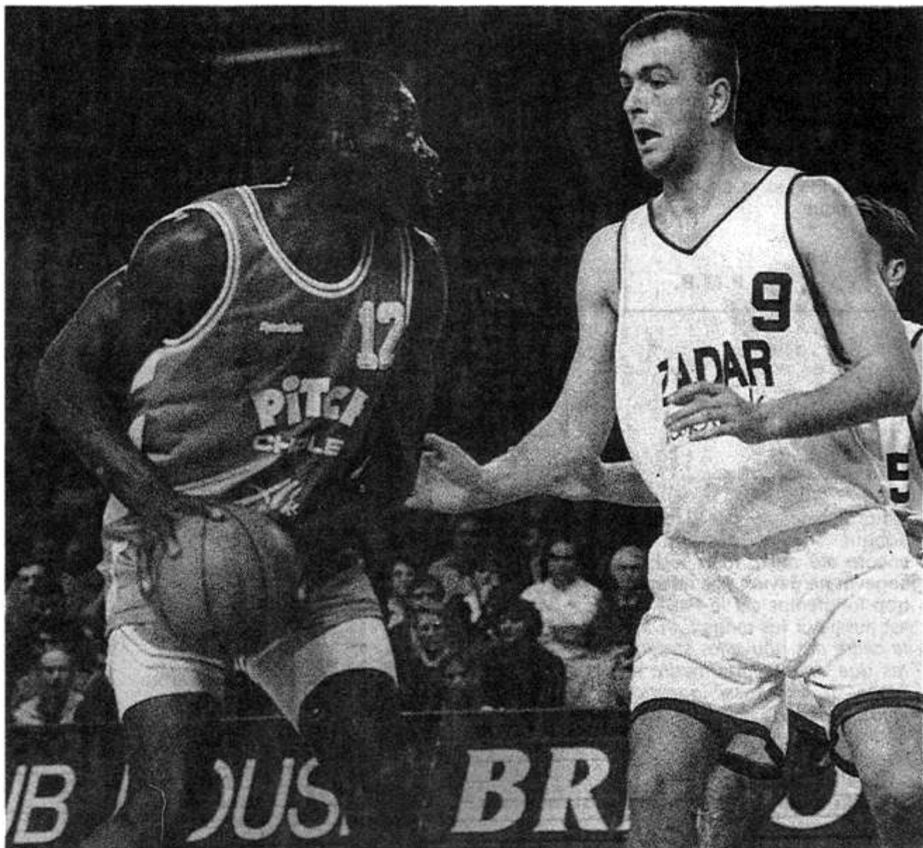
Une victoire de Vargas et CB sur Sarlija et Zadar mardi en Croatie conduira, automatiquement, les Choletais en demi-finale