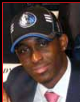
RODRIGUE BEAUBOIS Drafté par Oklahoma City en 2009 au 1 er tour en 25 ème position