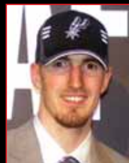
NANDO DE COLO Drafté par San Antonio en 2008 au 2 ème tour en 53 ème position