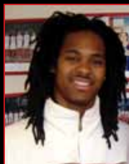
MICKAËL GELABALE Drafté par Seattle en 2005 au 2 ème tour en 48 ème position