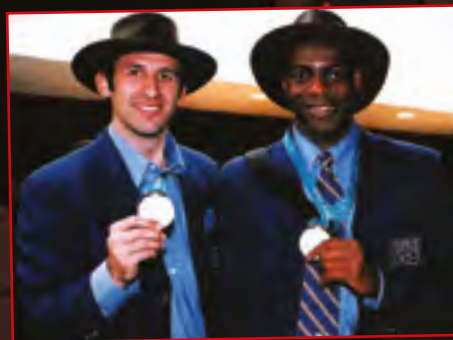
ANTOINE RIGAUDEAU et JIM BILBA, Médailleurs d'argent aux Jeux Olympiques de Sydney en 2000

★ VAINQUEUR DU TROPHÉE DU PRÉSIDENT 2007/2008