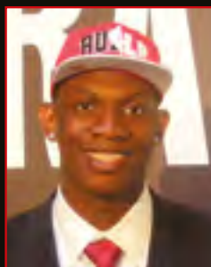
KEVIN SERAPHIN Drafté par Chicago en 2010 au 1 er tour en 17 ème position