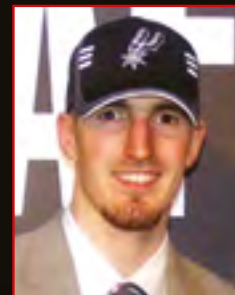
NANDO DE COLO Drafté par San Antonio en 2008 au 2 ème tour en 53 ème position