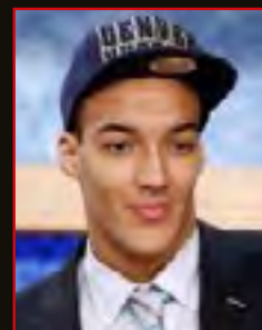
RUDY GOBERT Drafté par Utah Jazz en 2013 au 1 er tour en 27 ème position