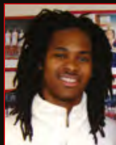
MICKAËL GELABALE Drafté par Seattle en 2005 au 2 ème tour en 48 ème position