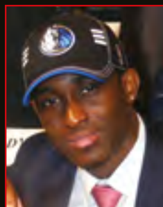
RODRIGUE BEAUBOIS Drafté par Oklahoma City en 2009 au 1 er tour en 25 ème position