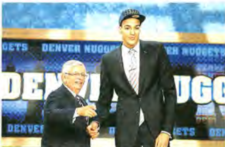
Rudy Gobert, aux côtés de David Stern, à côté d'un autre 3 e pické par Denver avant d'être transféré à Utah Jazz.

Un certain soulagement aussi, car s'il a fallu attendre jusque pratiquement la toute fin du premier tour, la destination ravit son entourage. « Utah, c'est