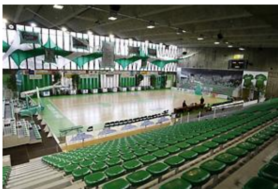
Palais des Sports de Nanterre