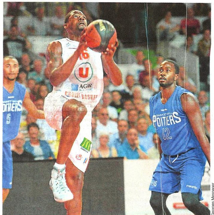
Delaney a réussi un match parfait offensivement avec 20 points marqués.

La marque choletaise : Delaney 20, Banks 6, Oliver 16, Minnerath 20, De Jong 13. Puis : Morin 3, Jomby 10, Morency 0, Moendadze 3, Smock 6, Chevrier 3.