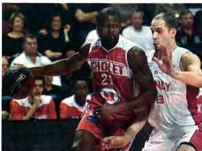
NANCY, PALAIS DES SPORTS

Avec ce succès, le club lorrain rejoint le groupe des cinquièmes