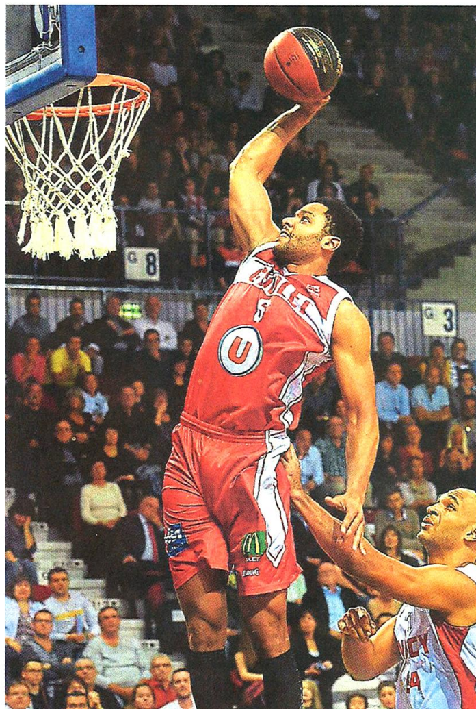
Nancy, hier. A l'image de Rudy Jomby, les Choletais ont fait le show mais ont craqué en fin de match.