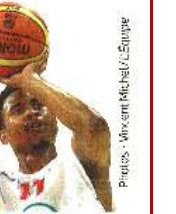
Chris Paul, meneur des Clippers.

LE MOT DU COACH : « C'est un joueur qui a une personnalité très forte. Il est un joueur qui a une personnalité très forte. »