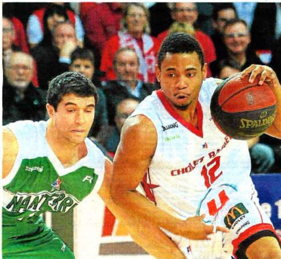
Sur la lancée de son exploit à Barcelone, Nanterre n'a pas laissé à Cholet le temps de rêver (59-79). page 15