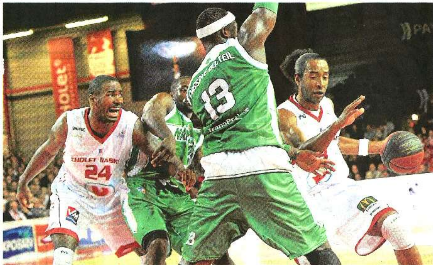
Cholet, La Meilleraye, hier soir. Cox bloqué face aux grands hommes verts de Nanterre, l'image d'un Cholet dominé par plus fort.

Les Choletais ont subi, hier soir sur leur parquet, la (dure) loi d'un Nanterre euphorique et porté par une adresse exceptionnelle. CB a chuté pour la première fois de la saison, et la chute a été spectaculaire.