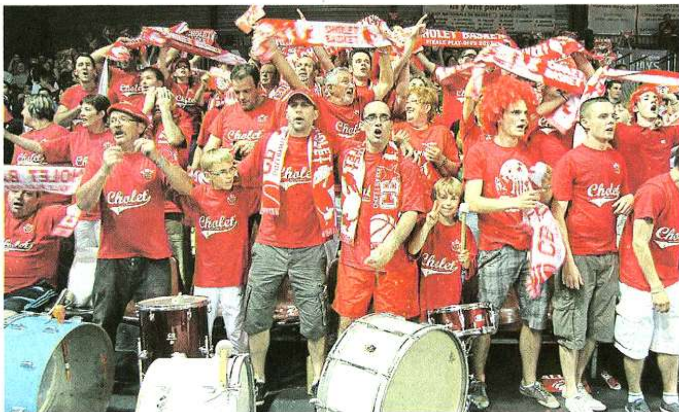
Les basketteurs de CB avaient un atout majeur hier soir sur Gravelines avec leur 6 e joueur, le public.

Cholet-basket a gagné 76 à 65 samedi soir contre Gravelines, lors des quarts de finale retour à la Meilleraie. Les passionnés du ballon orange ont tout donné, comme leurs joueurs. En attendant la belle !