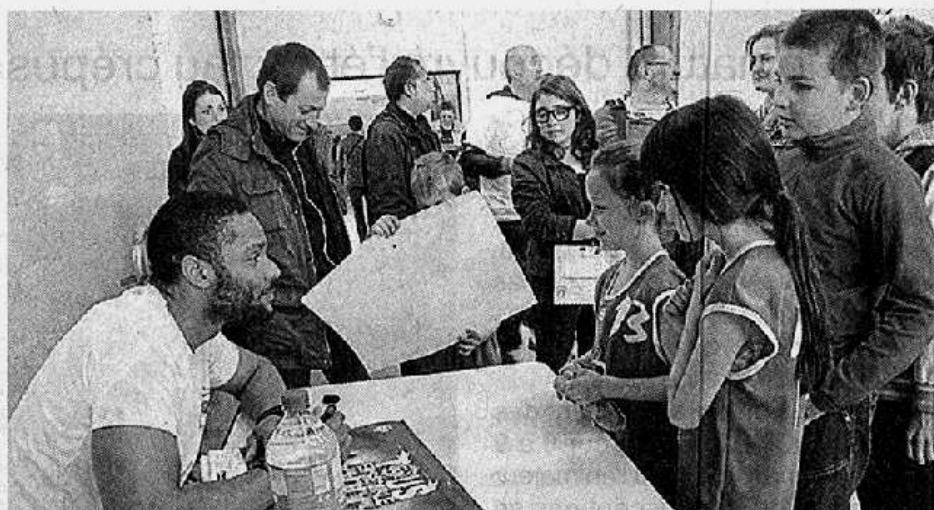
La venue de Rudy Jomby, samedi sur le terrain de Saint-Germain, a été un temps fort de ce tournoi jeunes.

Depuis son origine, ce grand tournoi de jeunes basketteurs regroupe toujours autant d'équipes qui viennent bien entendu du Maine-et-Loire, mais aussi des départements limitrophes que sont la Vendée, la Loire-Atlantique et les Deux-Sèvres. Cette année, 45 équipes (soit 400 jeunes de 8 à 13 ans) sont venues y participer. Pour marquer ce vingtième