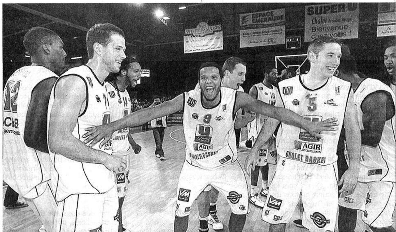
Les Choletais peuvent laisser éclater leur joie. Ils sont en finale !