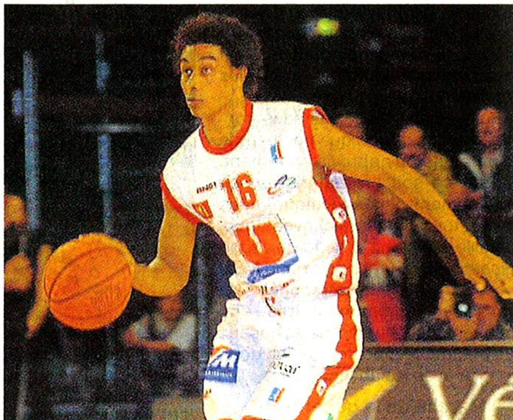
Archives Georges Mesnager