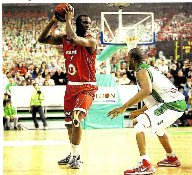
La défaite est honorable (84-74) mais Cholet n'a pas réussi à contester la supériorité de Nanterre. page 10