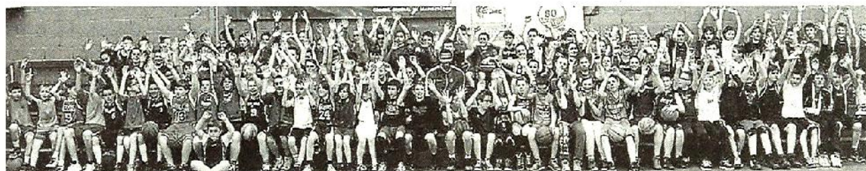
110 enfants de onze clubs des Mauges ont participé à la session Pro-Basket mercredi dernier.

Mercredi après-midi, La Séguinière basket a accueilli des joueurs pro de Cholet basket (CB) dans le cadre de la session pro basket. Une journée organisée en partenariat par le conseil général, le comité départemental, CB et La Séguinière basket. L'occasion, pour onze clubs des Mauges, de participer à des ateliers sportifs salle de l'Arceau.