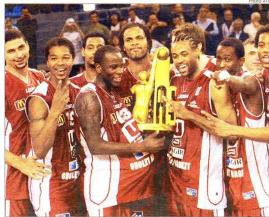
Pendant 3 jours, Cholet a bousculé la hiérarchie du basket français, s'offrant du même coup un billet pour la Coupe ULEB