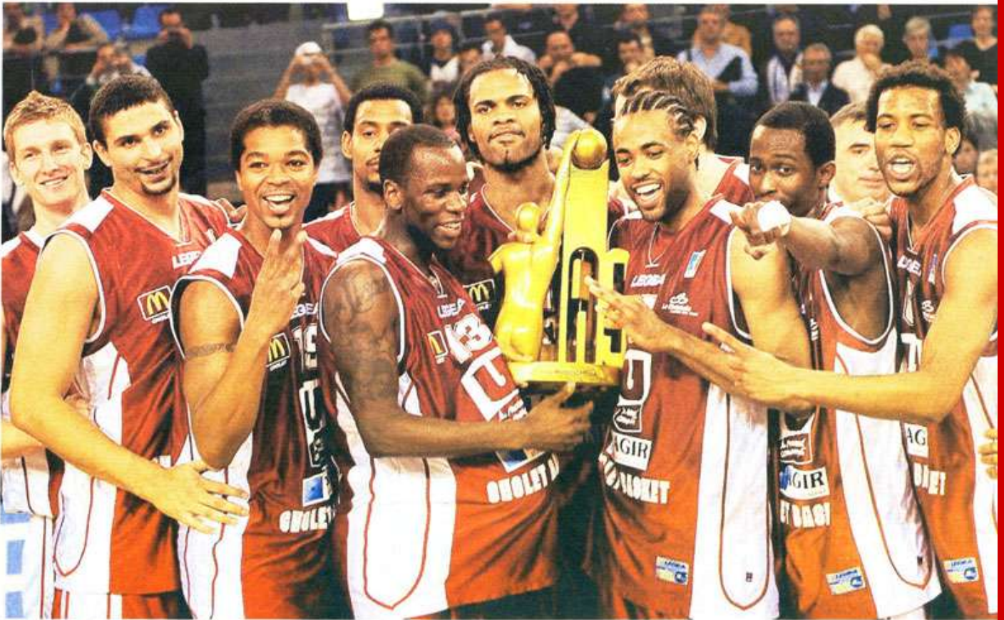
La joie des Choletais qui ont remporté haut la main la finale des As, hier après-midi, face à Vichy.

Semaine des As. Vichy - Cholet : 40-67. Les Choletais ont balayé des Vichyssois à la maladresse extrême et remportent leur premier titre majeur depuis 1999. Chapeau bas !