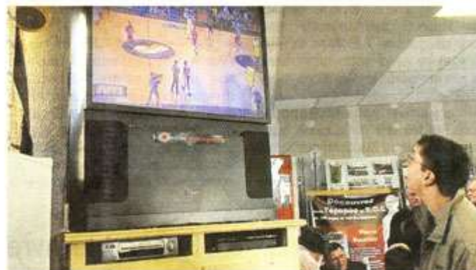
Scotchés devant l'écran, les supporters du Soc ont fêté l'exploit de CB.