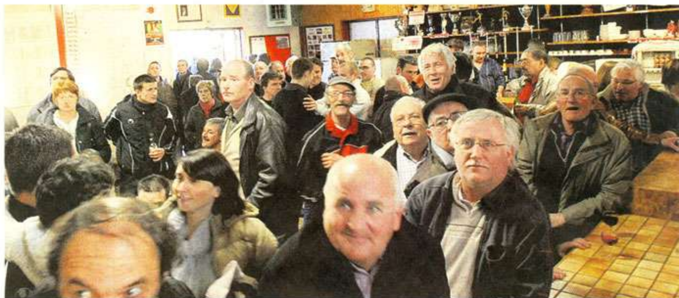
Le foot qui vibre pour le basket. C'était hier après-midi, dans le club house du Soc. Après le match, 70 personnes ont allumé la télé pour assister à une victoire historique pour Cholet.

A Toulon, le club a déjoué les pronostics pour remporter la Semaine des As. Un exploit qui fera date. Les supporters le fêteront aujourd'hui avec les joueurs.