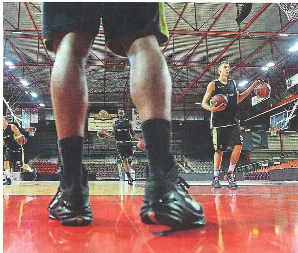
Cholet, La Meilleraie, hier. Les muscles des Choletais vont être très sollicités pendant les six semaines de préparation.

Effectivement, la moitié du mois d'août est propice aux pieuses intentions. Échaudé, le staff choletais a rectifié le tir par rapport à la saison passée qui avait pourtant bien démarré. « Nous allons partir cinq jours en stage à Lons-le-Saunier, dans le Jura, où nous disputerons deux matchs amicaux. Mais, le plus important sera