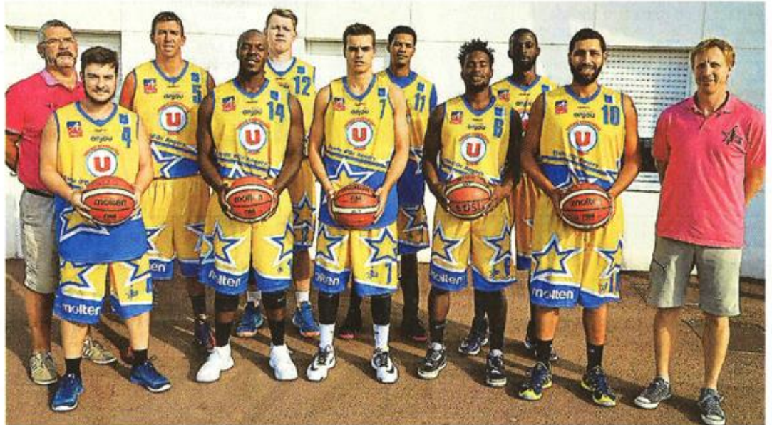
Angers, salle Villoutreys. Les joueurs de l'Etoile d'Or Saint-Léonard, pensionnaires de Nationale 2, défileront ce soir leurs homologues professionnels de Cholet Basket pour le compte des 32 e de finale de la Coupe de France.