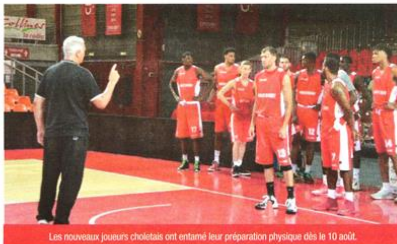
Les nouveaux joueurs choletais ont entamé leur préparation physique dès le 10 août.

Avec la signature d'un huitième et dernier nouveau joueur, Cholet basket a bouclé son recrutement. Le nouvel effectif a déjà repris l'entraînement depuis douze jours.