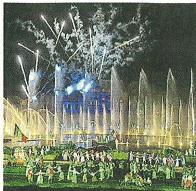
En juin, le taux de remplissage de la Cinéscénie était de 95 %.

Pourquoi cet engouement pour le Puy du Fou ? « Cette saison fait écho au plébiscite des Français. Ils ne se trompent pas en visitant ce parc atypique dont l'audace, la créativité et l'émotion sont au cœur de tous les spectacles », analysent les responsables du parc.