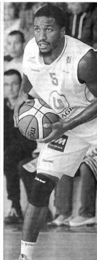
Les Américains Hughes, Taylor et Goods devront tenir les commandes du jeu extérieur choletais cette saison.