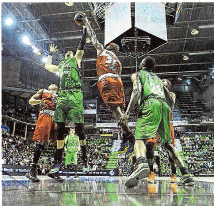
Le duel Andersen - Holloway, symbole d'une rencontre très physique.

Ce 8-0 décisif dans le money time, Cholet l'a aussi construit sur sa défense, variant les plaisirs pour perturber l'Asvel. « Ce sont ces trois stops