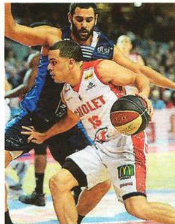
Angel Rodriguez et Cholet l'ont échappé belle face à Gravelines.

Limoges - Hyères-Toulon.....80-68 (23-15, 24-20, 12-18, 21-15) Arb. : MM. Bayot, Antiphon, Boubert. LIMOGES : Fair (25), Wood (13), Wojciechowski (6), Prepelic (20), Nixon (3), Camara (11), Zerbo (2). HYÈRES-TOULON : Udanoh (8), Acker (5), Evans (6), Michineau (5), Williams (3), Simpson (14), Chassang (7), Howard (10), Prénom (10).