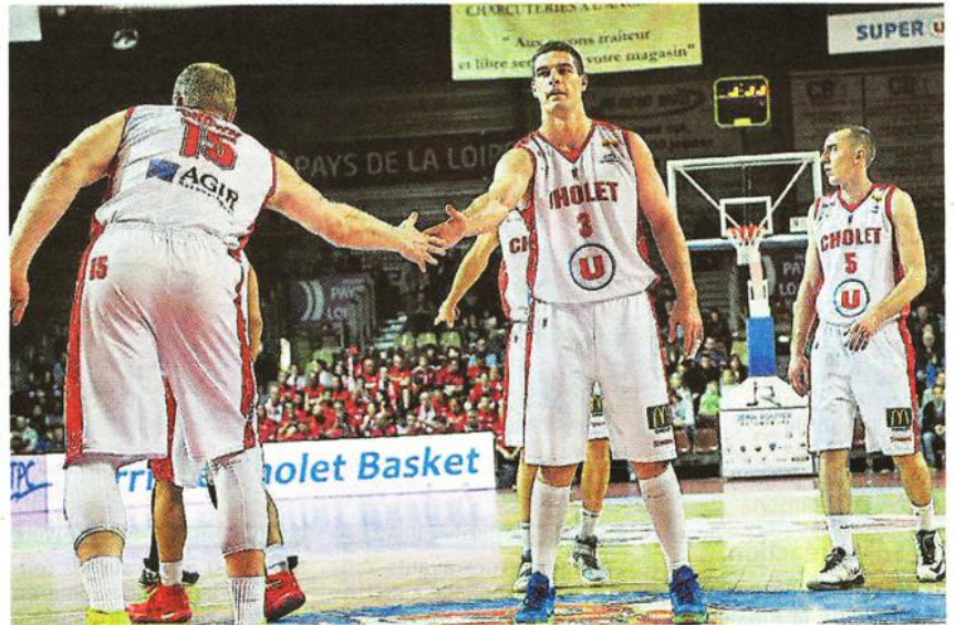
Cholet, La Meillaerie, samedi. Après quatre défaites consécutives, les Choletais ont su faire corps pour renouer avec le succès.

« Pendant notre série de quatre défaites, nous avons fait quelques bons matchs et nous aurions peut-être mérité une ou deux victoires. Alors là, tout n'a pas été parfait, mais nous comptons un succès de plus » , relance le meneur nordiste de