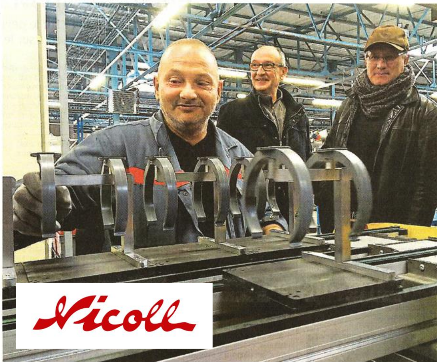
Cholet, samedi matin. Les anciens salariés sont venus en nombre lors de la journée portes ouvertes.