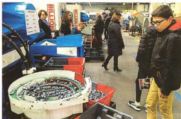
Les portes ouvertes de samedi ont rassemblé bon nombre de familles « Nicoll ». Les enfants et petits-enfants suivant la marche, certains avec beaucoup d'intérêt.