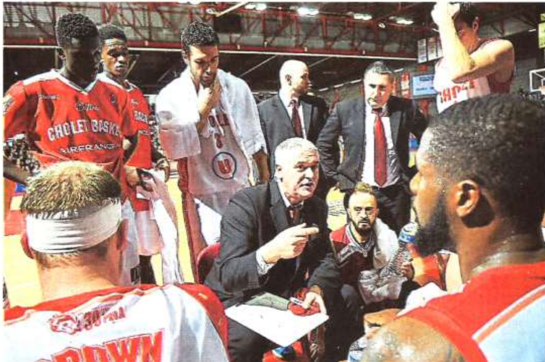
Cholet, La Meilleraie, hier soir. Les Choletais ont su réagir après le coup de froid à Dijon.

Hier, les Choletais ont en effet débuté la partie avec le trouillomètre à zéro. Et ensuite, ils ne se sont jamais, ou si peu, drapés de sérénité, même quand le scénario de la partie les y invitait. Ainsi, après être resté bloqué à 0 point durant... 4 minutes et 47 secondes (0-2), CB a bien cru, une dizaine de minutes plus tard, pouvoir se diriger vers un succès tranquille et aisé. Au quart d'heure de jeu, les hommes de Philippe Hervé menaient