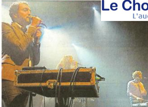
En plus de Glisséo, bientôt une nouvelle piscine couverte à Vihiers. Le réseau Choletbus devrait s'étendre dans les nouvelles communes de l'agglomération. Le Jardin de verre (ici un concert de The Husbands) pourrait programmer des spectacles décentralisés. Enfin, les vignobles du Vihiersois, un nouvel argument pour développer le tourisme du Choletais.

mandat. Or il en faut quatre », indique Jean-Pierre Chavassieux.