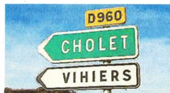
Cholet et Vihiers, des destins désormais liés.

Les élus du Choletais tiennent le même discours que leurs homologues des Mauges il y a tout juste un an : pas question de bouleverser les habitudes des citoyens. Les services restent en place et le principal changement est invisible. Il s'agit de ce lien qui permettra de mener des pro-