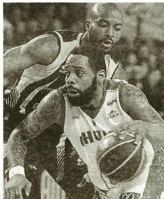
Swann et Cholet, battus dans les grandes largeurs.

(19-10, 22-22, 24-19, 19-20) Arbitres: MM. Bayot, Oliot, Rosso. VILLEURBANNE : Dragovic (10), Hodge (21), Nelson (6), Watkins (2), Lang (15), Sy (11), Noua (2), Meacham (15), Uter (2). NANCY : Mallet (10), Trasolini (11), Urtasun (23), Rush (6), Hunt (15), Jeanne (3), Mbaye (3).