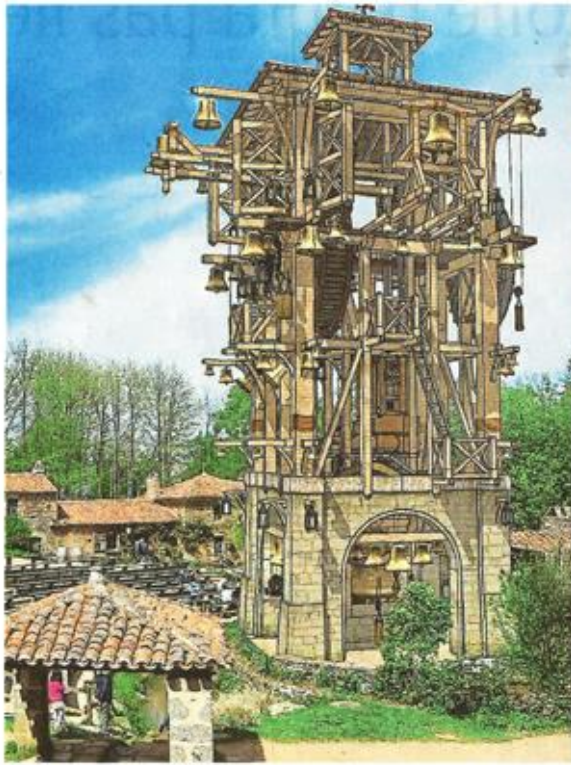
Pour ses 40 ans, le Puy du Fou a investi près de 30 millions d'euros. L'enveloppe comprend aussi bien le nouvel hôtel (en bas à droite), que le grand carillon (à gauche), le nouveau décor de la Cinéscénie (en haut à droite) ou le nouveau restaurant (voir ci-contre). La saison 2017 débute le samedi 1 er avril.

Nom de code : Citadelle. Capacité d'hébergement : 448 lits pour une centaine de chambres. Superficie de chantier : 1 hectare et demi. Coût de l'opération : 15,5 millions d'euros. Voilà en quelques chiffres - majuscules - une des grandes nouveautés de la saison 2017 du Puy-du-Fou. La Citadelle est le cinquième hôtel du parc vendéen, ce qui porte la capacité d'accueil à 2 000 lits. « C'est une réalisation exceptionnelle, n'hésite pas à dire Nicolas de Villiers, le grand ordonnateur du Puy-du-Fou. La Citadelle est notre hôtel le plus cher qu'on n'ait jamais construit. Mais qui n'a pas révé de dormir dans un château-fort ? » En ce moment, 250 personnes travaillent derrière les hauts remparts, où l'architecture balaise plusieurs époques, du 13 e au 17 e siècle. But de l'opération : fixer encore un peu plus le visiteur sur le parc. « Il faut désormais plus d'une journée pour voir tous les spectacles », glisse d'ailleurs Nicolas de Villiers. Aujourd'hui, 10 % des visiteurs passent une nuit sur place. Avec la Citadelle, ce chiffre devrait vite gonfler. A noter que l'hôtel proposera un nouveau service de