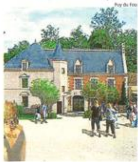
La Mijoterie du Roi Henry va proposer 800 couverts : 400 en extérieur et 400 en intérieur. Le restaurant sera spécialisé dans les plats typés Renaissance.

Le parc de loisirs vendéen, qui fête cette année ses 40 ans, vient d'investir 30 millions d'euros. L'anniversaire est somptueux.