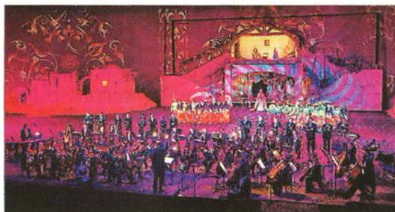
Le Grand Noël fera une pause en 2018 avant de revenir en 2019 avec « un nouveau grand spectacle hivernal ».

La première séance de la Cinéscénie complète en une minute. À côté du Grand Parc, il y a aussi la Cinéscénie. Cette année, le spectacle de nuit aura lieu les 2 et 9 juin, puis tous les vendredis et samedis du 15 juin au 8 septembre 2018. Pour les impatients, inutile de penser à se déplacer à la première séance du 2 juin. Elle est déjà complète. « La billetterie s'est ouverte le 3 octobre et en une minute, il n'y avait plus une place », glisse Nicolas de Villiers. Rappelons