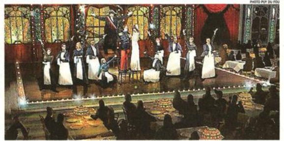
Le Café de la Madelon prendra place à la Halle Renaissance.