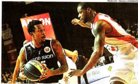
LE COMBAT. Pendant tout le match, les candidats au maintien, le Dijon de Miles et Choleat ont fait jeu égal. Mais, à la fin, seul CB a fait la bonne opération.