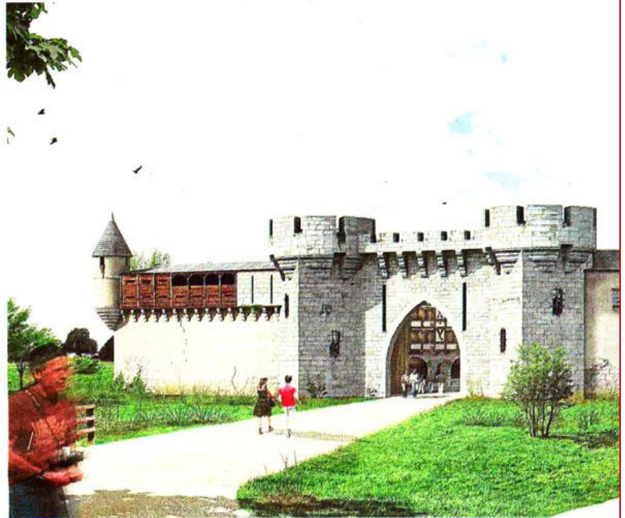
L'hôtel de la Citadelle sera inauguré le 1er avril 2017. Il comporte 98 chambres dans une reproduction très fidèle d'un château fort.

(Les Epesses) Président Nicolas de Villiers 190 permanents 1.700 saisonniers 100,8 M€ de CA en 2016 www.puydufou.com