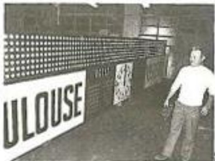
Les tableaux d'affichage sportif ont été lancés en 1968.

Un siècle après sa création – en 1968 – Bodet réalise son premier tableau d'affichage sportif : Bodet Sport est lancé. Et le temps fait tout