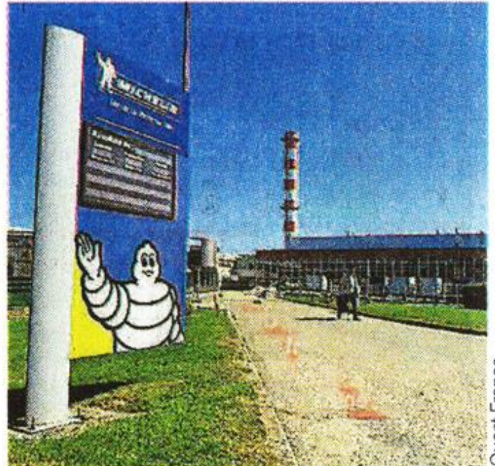
Le site de La Roche reçoit le plus fort investissement de Michelin en France.

Le groupe investit depuis plusieurs années en vue de moderniser les