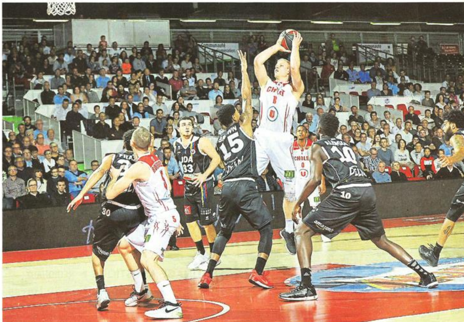
Cholet, salle de La Meillaeraie, 7 octobre 2017. Palisson et Cholet jouent ce soir un match capital pour leur fin de saison.

La réception de Boulazac, ce soir, va conditionner la fin de saison de Cholet Basket. Un succès serait synonyme de quasi-maintien. Une défaite, au contraire, aggraverait la crise.