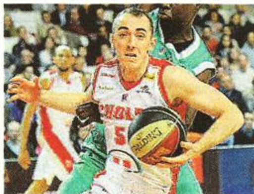
Rousselle va manquer à la mène.

Comme à mon habitude, je n'hésiterai pas à aider qui que ce soit. Je vais être acteur, pas rester assis sans rien dire. C'est terrible à vivre, mais ça peut être aussi l'occasion de voir les