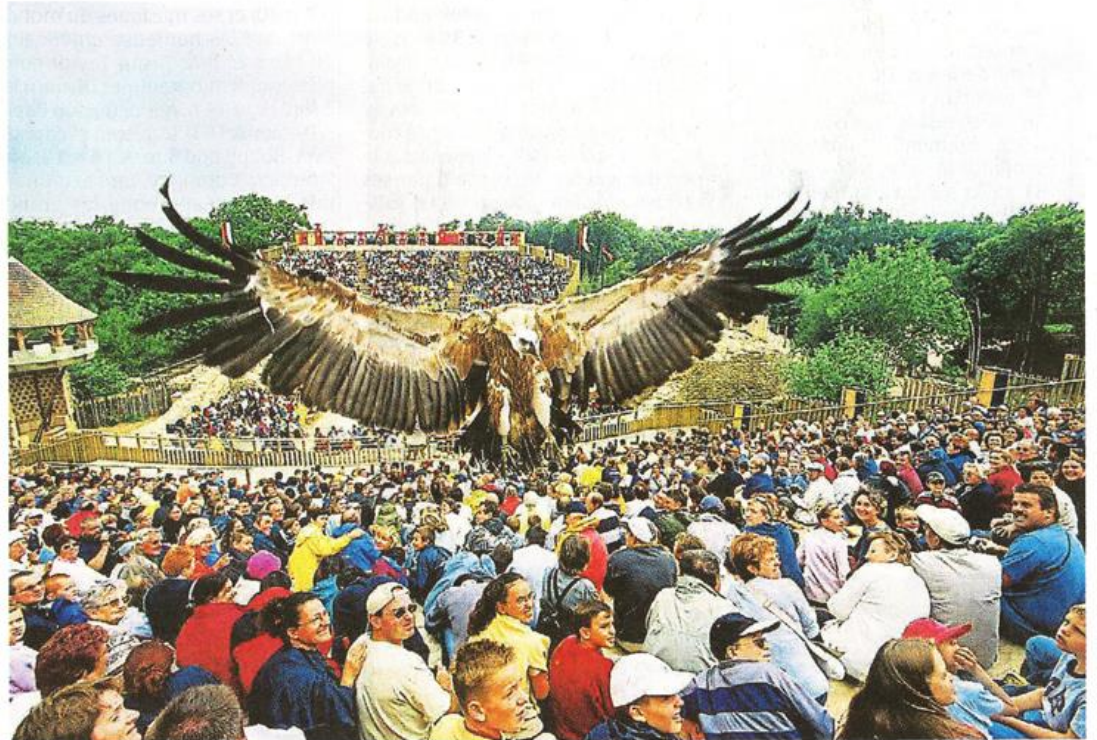
Les Epesses. Le parc du Puy du fou entend bien continuer à voir sa fréquentation s'envoler.

Le fondateur et scénariste du parc vendéen, l'homme politique de droite Philippe de Villiers a salué « la course astrale formidable que les 40 ans vont commémorer ».