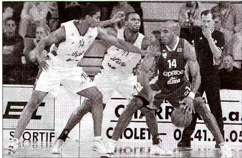
Hayes et Marquis ne furent pas de trop pour concéder Ruffin, mais les Choletais eurent le dernier mot.

Ce ne fut qu'un feu de paille. Replacé en défense, Cholet contourna à nouveau le tempo de la rencontre tandis que les intérieurs espagnols franchirent les frais de ce regain défensif.