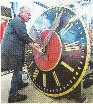
Bodet, spécialiste du temps qui passe.

Le temps passe. Ce n'est pas chez Bodet, spécialiste des cloches, des horloges, des affichages sportifs et des emplois du temps électroniques, qu'on dira le contraire. L'année 2018 qui s'achève a vu Bodet souffler ses 150 bougies.