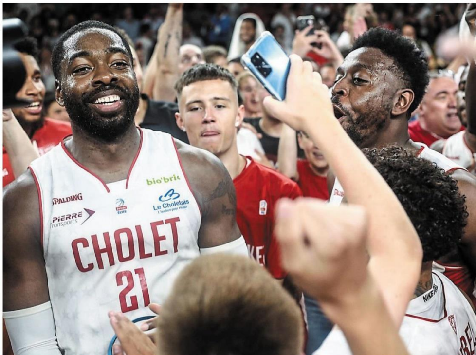
Une semaine après sa victoire face à Monaco qui lui a ouvert le chemin des play-offs, Cholet Basket s'est rendu, mardi, en terre lyonnaise pour y affronter l'Asvel. Avec une victoire surprise à la clé.