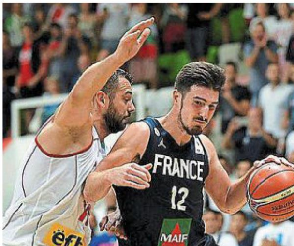
Nando de Colo.