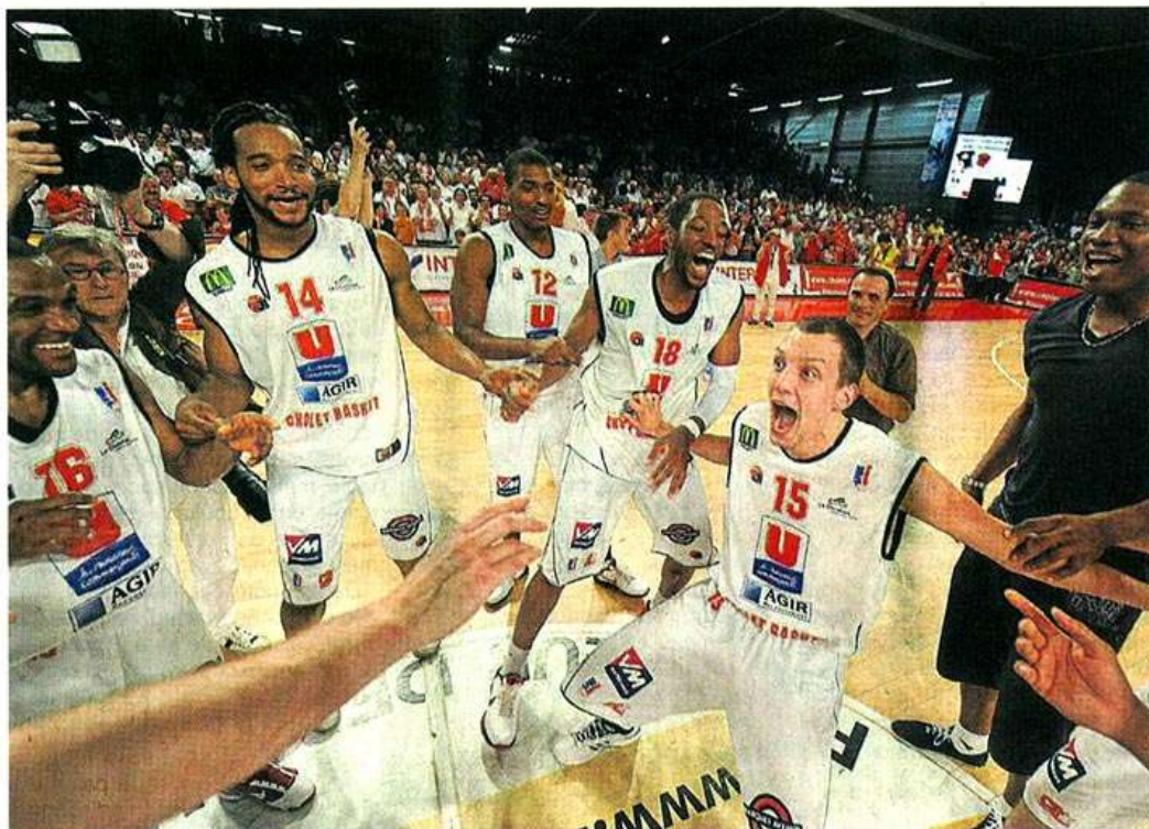
L'équipe de Cholet-basket, quelques instants après sa qualification pour la finale, il y a une semaine. Ce soir-là, la salle de la Meilleraie et ses 5 000 spectateurs étaient en ébullition.