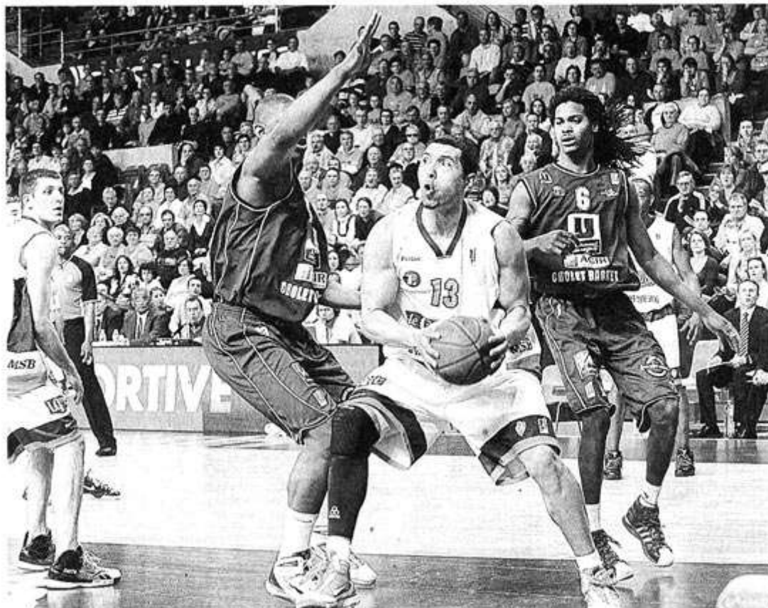
Le rebond, ce sera aussi une affaire épineuse entre Choletais et Manceaux. Ces derniers comptent sur Batista pour veiller au grain sous les cercles.

LE MANS : 4. Wright; 5. Lombahe-Kahudi; 6. Spencer; 7. H. Kahudi; 9. N'Doye; 11. Yango; 12. Rupert; 13. Batista; 15. Salyers; 16. Samake; 18. Drouault. Ent.: JD Jackson.