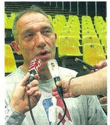
Kunter a été très sollicité par les médias.

Le Courrier de l'Ouest – Dimanche 13 juin 2010