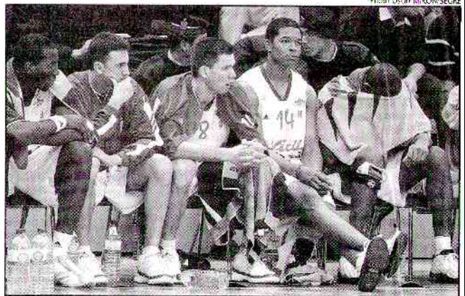
Le banc choletais a assisté impuissant au dernier quart-temps cauchemardesque de leurs coéquipiers

Après avoir quitté la salle sonnés par le gros coup de massue qui venait de s'abattre sur leurs têtes, les Choletais avaient bien sûr le cœur lourd.