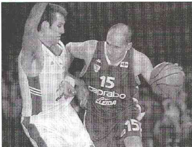
Scout Barry tint longtemps à bout de bras le navire choletais, mais quand la tornade du Caprabo atteignit son apogée dans l'ultime quart temps elle balaya comme fétu de paille les dernières illusions des basketteurs des Mauges.

Ainsi l'avantage de C.B. à la pause pouvait entretenir tous les espoirs, même si l'édifice demeurerait fragile car reposant sur la seule réussite des tireurs choletais. Néanmoins cette fluidité dans le jeu et cette propension à bien faire circuler le ballon avait