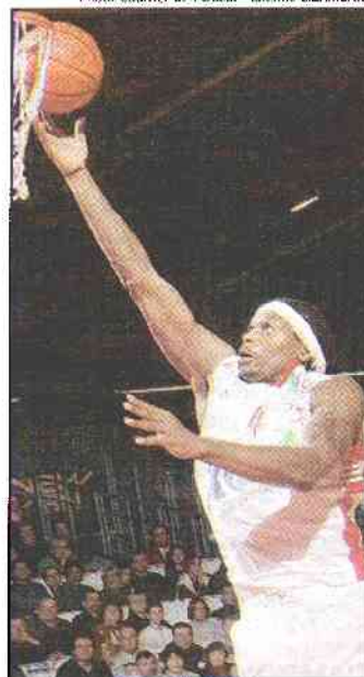
Les Choletais jouent demain soir leur avenir en Coupe ULEB