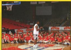
Intervention de Ron Anderson (ex-joueur NBA) lors du 18 ème camp.

Les camps sont ouverts aux garçons comme aux filles nés entre 1985 et 1995 (inclus).