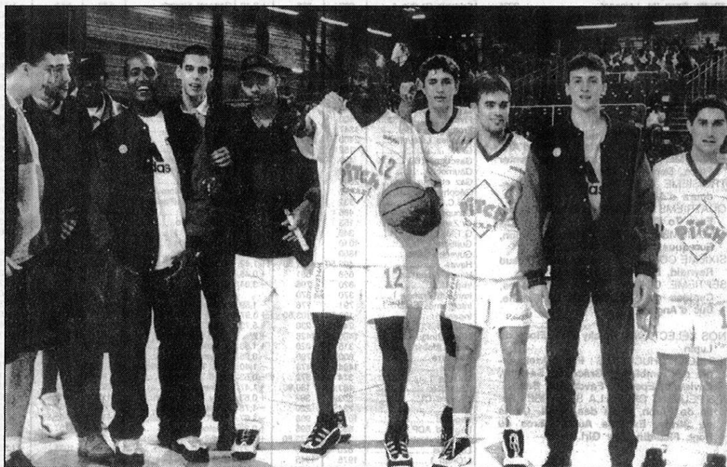
Les Espoirs de Cholet Basket futurs champions de France...

Une succession de pépins physiques qui n'auront guère entamé le bel ordonnancement du groupe, redoutable d'efficacité dès ses premières sorties, comme en témoignent