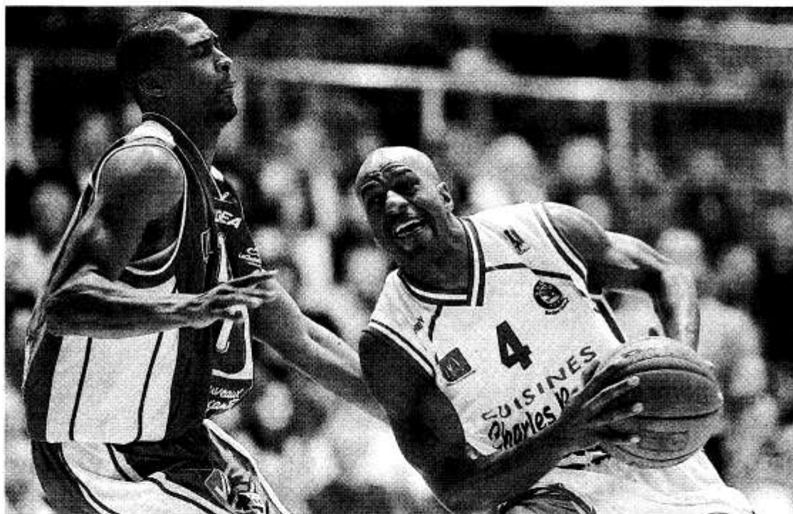
Les Choletais ont fait preuve de beaucoup d'envie, défensive en particulier face à Bourg-en-Bresse.

Avec un jeu de plus en plus teinté d'approximations, sous la