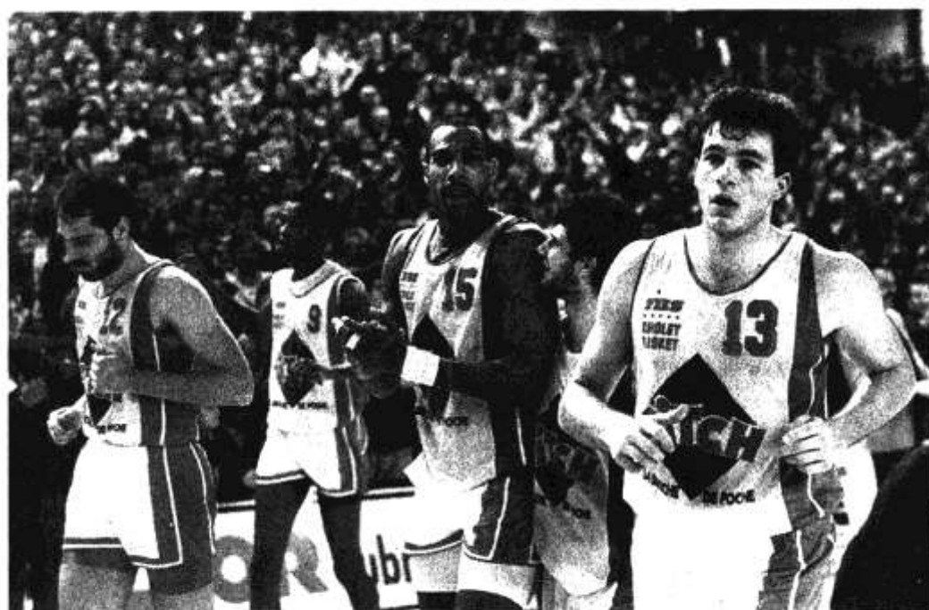
Des Choletais qui rêvent de pareil tour d'honneur en Touraine.

■ SYMPA, l'exposition photographique du Centre de documentation du basket français présenté au palais des sports de Tours. Et prélude à l'ouverture attendue cette année d'un musée du Basket hexagonal.